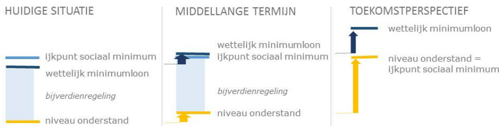
Figuur 1: Perspectief inkomenskant 1

1 Bij huidige situatie is de situatie voor Bonaire weergegeven waar het huidige niveau van het wettelijk minimumloon onder het niveau van het ijkpunt sociaal minimum voor een alleenstaande ligt. In de hoogte van het ijkpunt is uitgegaan van een redelijk niveau van de kosten voor basale uitgaven.